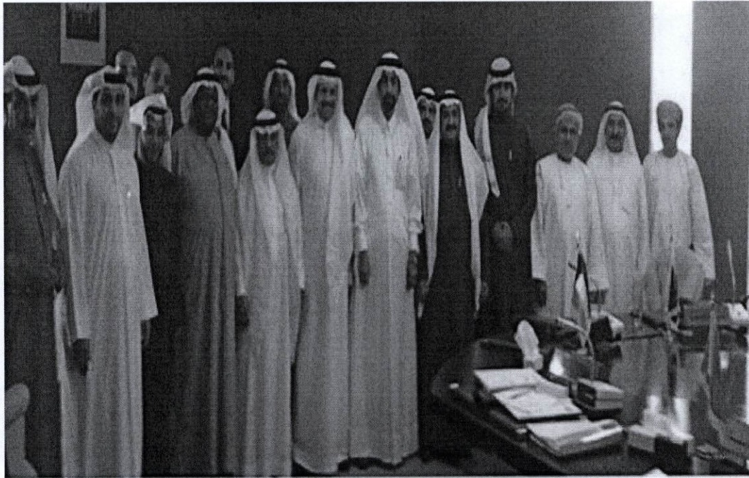
وزارة الاقتصاد تشارك في اجتماع اللجنة الخليجية الدائمة لمكافحة الممارسات الضارة في التجارة الدولية